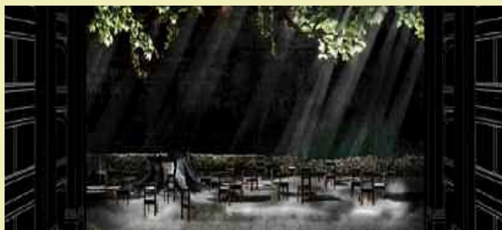
In questa pagina e alle pp. 12-13, i bozzetti delle scene di Sergio Tramonti per Cavalleria rusticana .