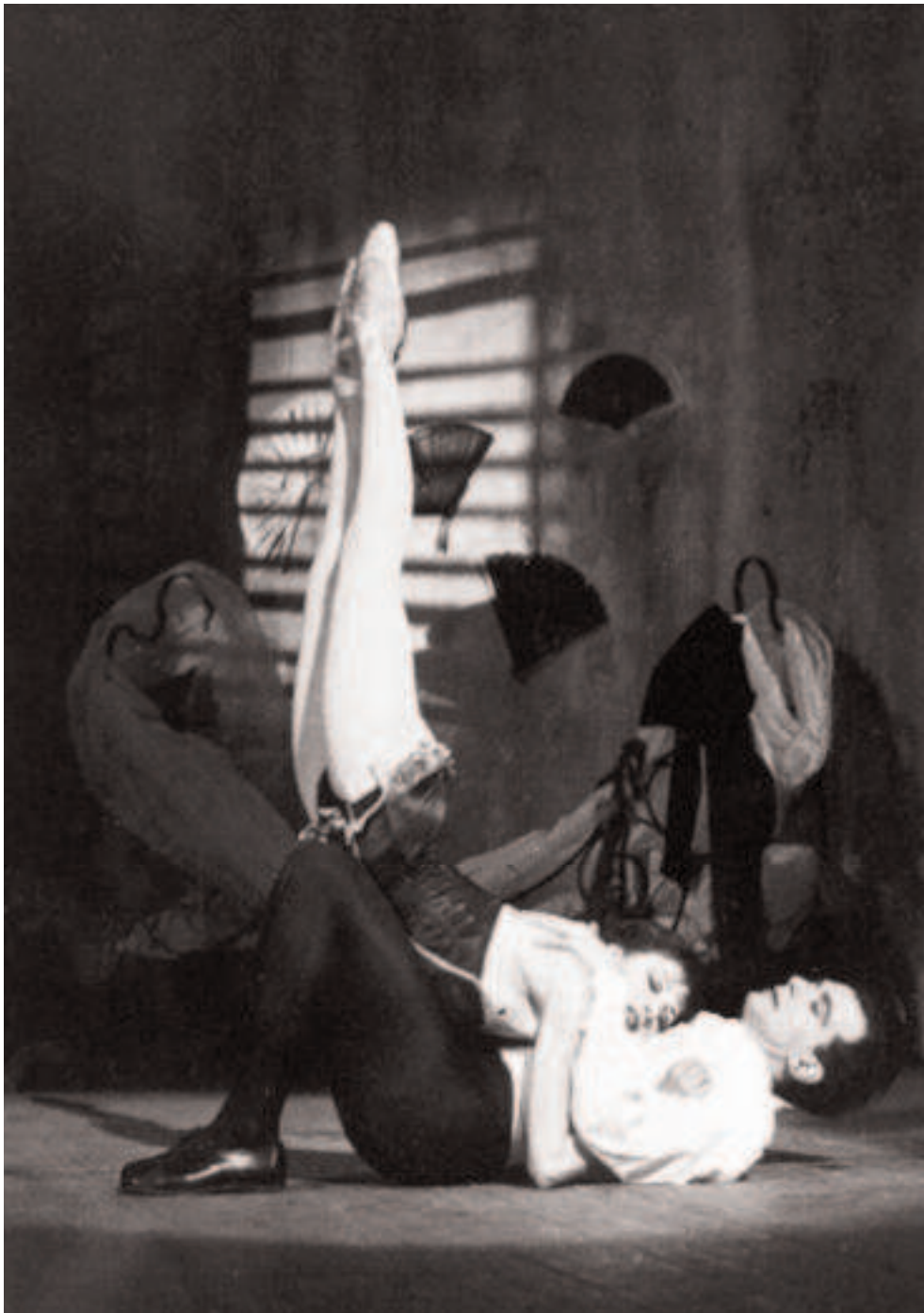
In questa pagina e alle pp. 53 e 55: Zizi Jeanmaire e Roland Petit, Carmen , Londra, Prince's Theatre, 1949.